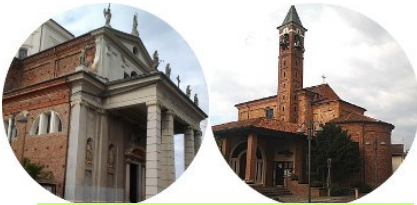
Bernate - Casate